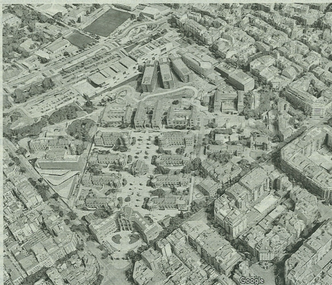
Hospital de San Pau y Santa Creu en Barcelona.

en última instancia, alegando que, consultada la comunidad sanitaria, esta prefería la primera opción. Una elección acompañada del anuncio de una inversión de 395 millones de euros.